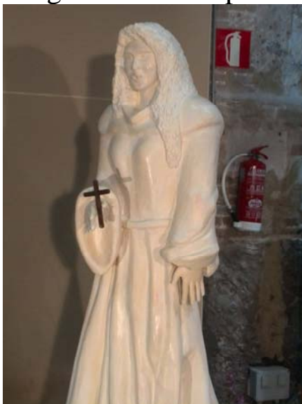
Escultura de Santa Clara de Assís

Como ya ocurrió en una ocasión anterior, el escultor valenciano Antonio Tirado expuso su obra “Santa Clara de Assís”. Imagen que complementa a la realizada de San Francisco de Assís por el propio escultor. Ambas imágenes compartieron espacio en la Casa-Museo.